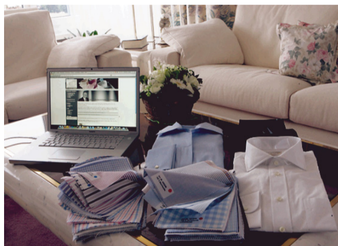
Auf Lorenz' Website kann man zwischen 200 Stoffen wählen.

FUNDSTÜCKE: FEUERZEUG AUS DEM BODEGA-SHOP IN LANGNAU